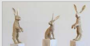
JAN THOMAS Trophäen

▼ Vernissage: Mittwoch, 9.1. 2019 um 19.30 Uhr bis zum 17.2.2019