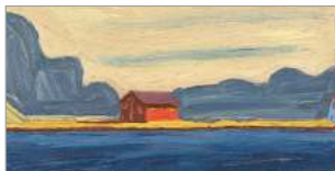
CHRISTOPH DREXLER Landschaft & Zeiträume