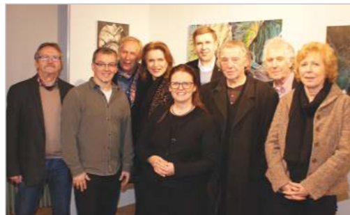
Der Vorstand und die Beiräte

Galerie im Theresienstein Am Theresienstein 1 • 95028 Hof • 09281 - 97 20 54 info@kunstverein-hof.de • www.kunstverein-hof.de