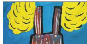
KEVIN COYNE Crazy

▼ Vernissage: Mittwoch, 27.2.2019 um 19.30 Uhr bis zum 31.3.2019