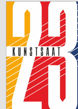
KUNSTSAAT XXIII Mitgliederausstellung

▼ Vernissage: Mittwoch, 16.10.2019 um 19.30 Uhr bis zum 24.11.2019